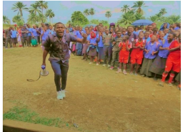
Die Schüler waren begeistert und haben spontan gesungen, um sich bei der Prinzessin Belle zu bedanken.