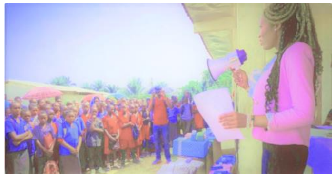
Prinzessin Rachel Belle spendete Schulmaterial und Geschenke an die Studentenschaft.