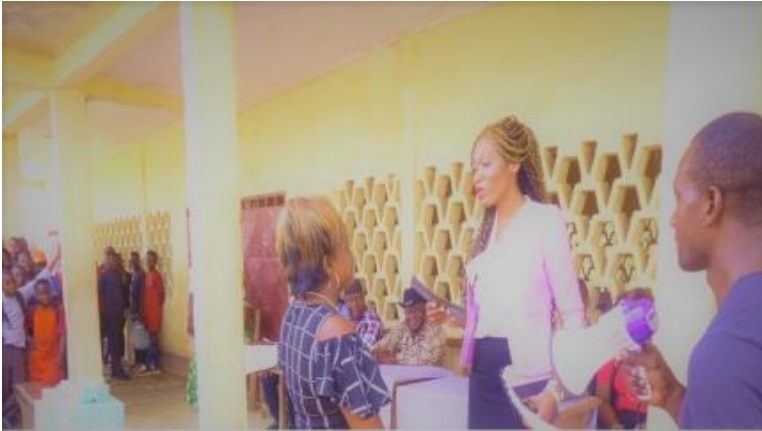
CEO der AAA Intergalactic Prinzessin Belle verteilte Geldgeschenke an die besten Professoren in Afrika.

Die AAA Intergalactic Stipendien sind nicht nur eine „nette Geste“. Sie sind wichtige Investitionen, um Studenten, vor allem jungen Frauen und verschiedenen Weltgemeinschaften dabei zu helfen, die Armut abzuwenden.