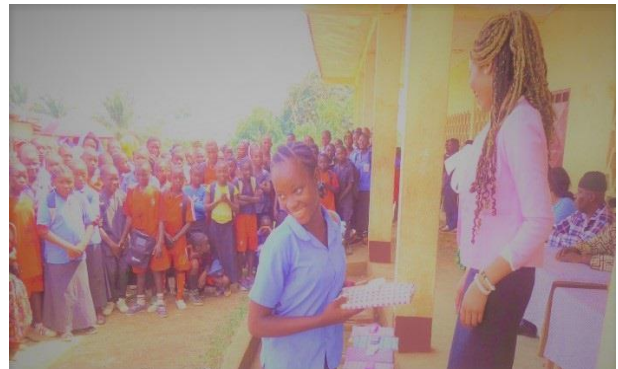
CEO der AAA Intergalactic, Prinzessin Belle verteilte Stipendien