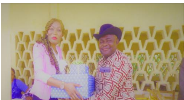
Die Vorstandsvorsitzende spendete Schulmaterial für das Lycée-Management, Geschenke an die besten Lehrer